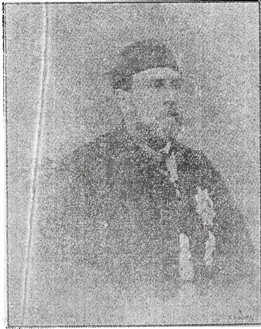
اسماعيل باشا الخديوى حفيد محمد على باشا

الى الحكومة والشريعة فلم يرضوا بذلك والحال بحضرة جمع من المسلمين ما كثر على أبيار للسقى ثم توجهوا به وقتلوه قتل الجاهلية بالتقطيع واته الآن طلب منهم عيسى بن كير وعلى بخيت وريت المشار عليهم - فأجاب اثنان - بانكار قتل الولد بقولهما لم تقتل ولد على باكرار المدعى هذا فأجاب عيسى بن كيراني ابن آدم موسى الثالث المذكور باقرار قتل الولد المذكور بقوله : نعم أنا الذى قتلت الحسن ولد على باكرار المدعى هذا ذبحا فى رقبته قصاصا عن أخى الذى قتله حسن المذكور بضربة فأس وقال ان المنكرين قد صدقا فى انكارهما قتل الولد فلما علم المدعى اقرار عيسى المذكور بذبحه لولده المذكور ترك المنكرين وجعل عيسى المقر على نفسه